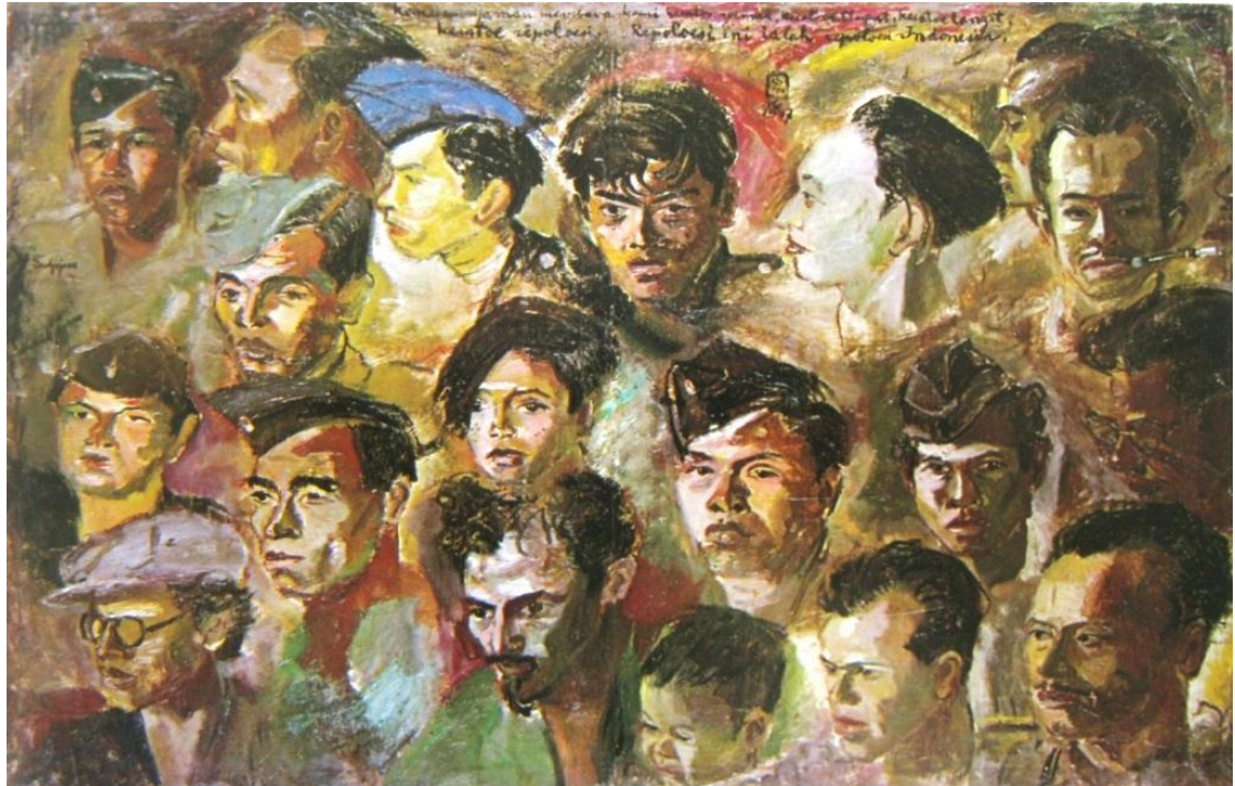
S. Sudjojono. 1964. "Kawan-kawan revolusi". Lukisan cat minyak. Koleksi Museum Seni Rupa dan Keramik di Jakarta.